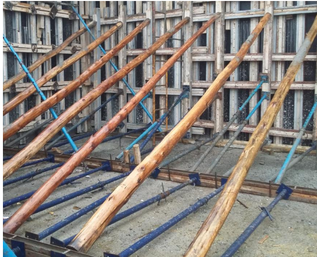
Fig. 4: Apuntalamiento de los encofrados

Una vez controladas las armaduras, se realizó un replanteo de los tabiques de H°A° en el piso (usando tanza, tizador o “chocla”, y cinta métrica), y los fondos de vigas y losas con sus respectivos niveles en las paredes (pasando niveles con una manguera transparente y, a veces de forma más precisa, empleando un láser autonivelante). De esta manera, los encofradores podían cerrar todas las caras de cada elemento para poder ser hormigonado, posicionándolo verticalmente con la ayuda de una plomada. Cuando se quería dejar el hormigón visto se usaban fenólicos en buenas condiciones (correctamente apuntalados), caso contrario se usaban fenólicos viejos o desgastados.