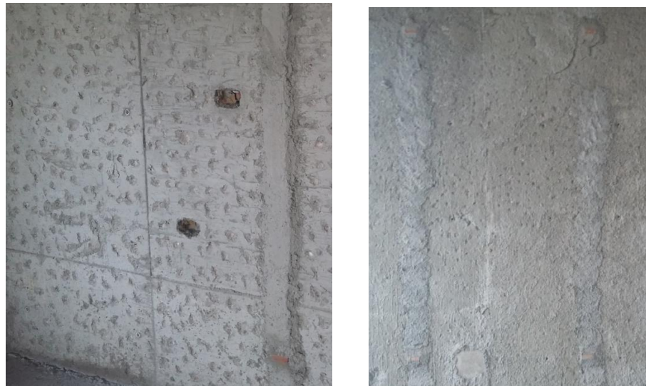
Fig. 14: Picado de pared de H°, chicoteado y colocación de fajas

arena + cemento para lograr una pared rugosa. Además se le agregó un adhesivo (emulsión sintética) al mortero (compuesto por agua + cemento + cal + arena gruesa) y así aumentar la adherencia. En este paso se corrigieron los posibles desaplomes que pudiera haber en las paredes, terminando dicha capa mediante fajas verticales (dando el espesor y actuando como guía), con la ayuda de una regla metálica. Cuando el desaplome implicara colocar una capa de más de 5cm se agregó una pequeña malla metálica para darle un soporte estructural (debido al elevado peso tendría). Una vez colocada esta capa, se hizo el revoque fino (enlucido) en una capa de 1cm, consistiendo en una mezcla de agua + cemento + cal + arena fina. Finalmente, en los ambientes donde se quería dejar una terminación bien lisa y pareja de la pared, se colocó una capa de yeso de 1cm.