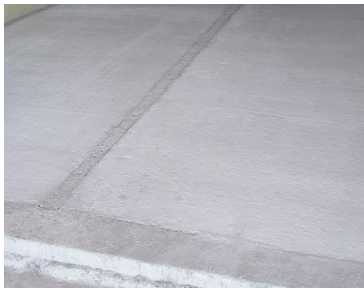
Fig. 11: Colocación de contrapiso alivianado