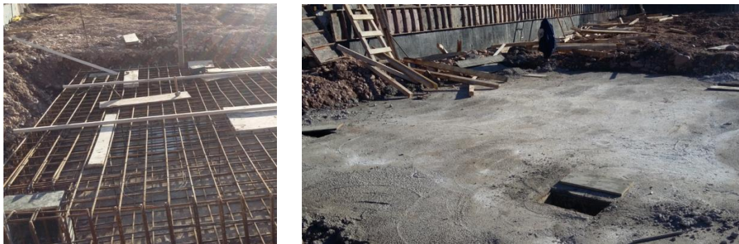
Fig. 8: Base de la grúa

Otro trabajo de replanteo que se realizó fue el de la base para la grúa, el cual se hizo en el terreno natural. Para determinar la ubicación más óptima de la grúa se tuvo en cuenta el alcance del brazo de carga de la misma, para que cubriera la mayor parte del edificio. Pero también fue necesario considerar su respectivo montaje para orientar la base de la grúa, ya que la misma se arma con toda su extensión horizontal sobre el suelo y luego se posiciona en altura con gatos hidráulicos que van subiendo la “pluma” piso a piso, por lo que no debería haber ninguna parte de la estructura del edificio que en un futuro se interpusiera con el desarmado de la misma.