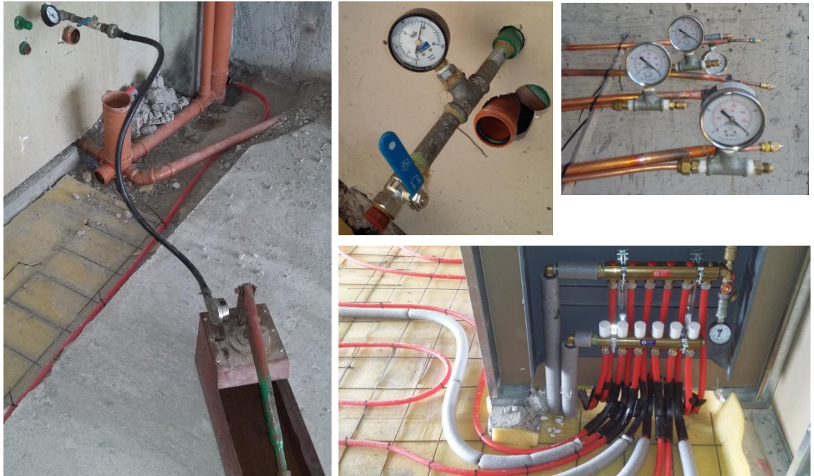
Fig. 18: Manómetros de cada sistema presurizado

24hs y se volvía a controlar el manómetro, para verificar que no hubiera ningún tipo de pérdida en la instalación; y que en caso de haber una fuga, poder arreglarla.