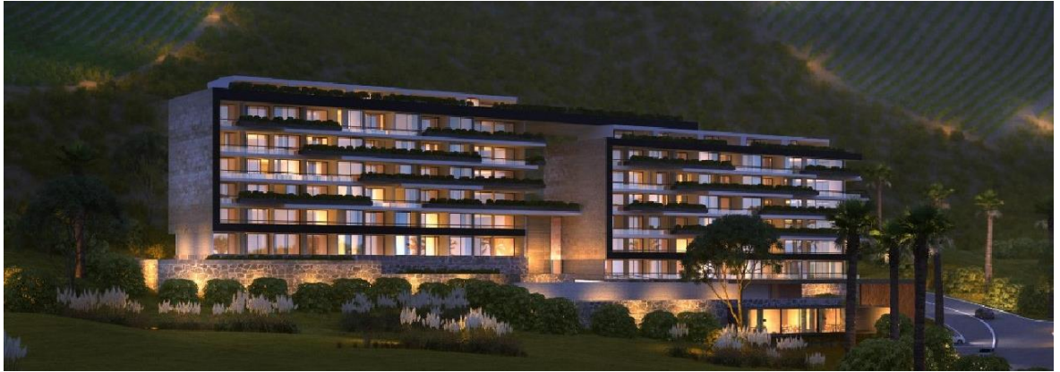
Fig. 1: Proyecto terminado de ambas torres

Consta de un edificio que se divide en dos partes: la torre norte y la torre sur. La torre norte se encuentra en una etapa más avanzada, con las instalaciones y terminaciones finas, mientras que la torre sur se encuentra en la etapa de obra gruesa, a nivel de fundaciones y subsuelo.