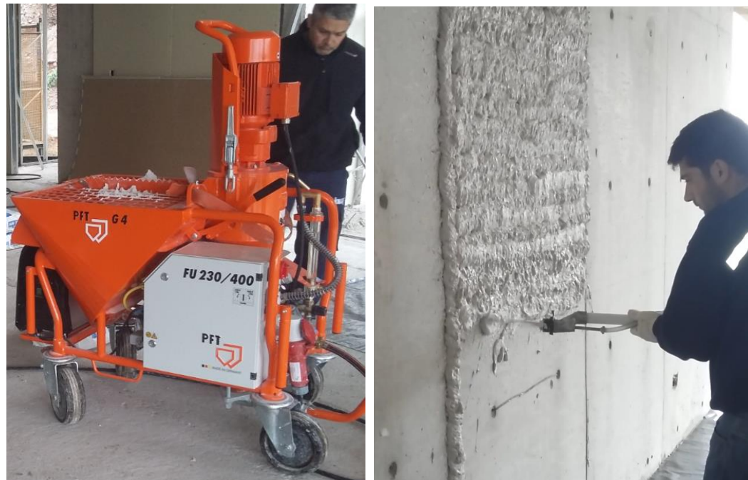
Fig. 16: Máquina de proyectar para yeso y su aplicación

Para la aplicación del revoque de base de yeso en ambientes interiores se estaba evaluando el uso de máquinas de proyectar, debido a la gran cantidad de superficies a revocar (es más fácil, se ahorra tiempo y es más económico que el método tradicional, ya que se pierde menos material). Además, el producto usado puede ser aplicado en cualquier superficie sin hacer un tratamiento previo en la misma.