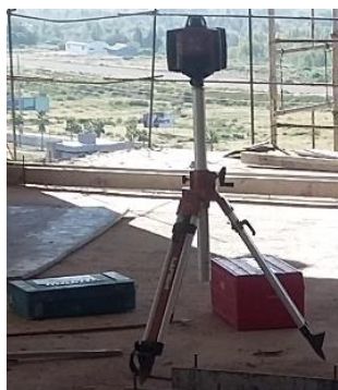
Fig. 9: Láser autonivelante

En la torre norte se estaban realizando diversos trabajos de obra fina en cada unos de los 7 pisos del edificio, comenzando desde los niveles inferiores hacia arriba. Lo primero que se realizó en cada piso fue, mediante un nivel de referencia definido (generalmente se toma 1m desde el nivel de piso terminado), llevar ese nivel a toda la planta de dicho piso. Para esta tarea se utilizó un láser autonivelante, como el que se ve en la fig. 9.