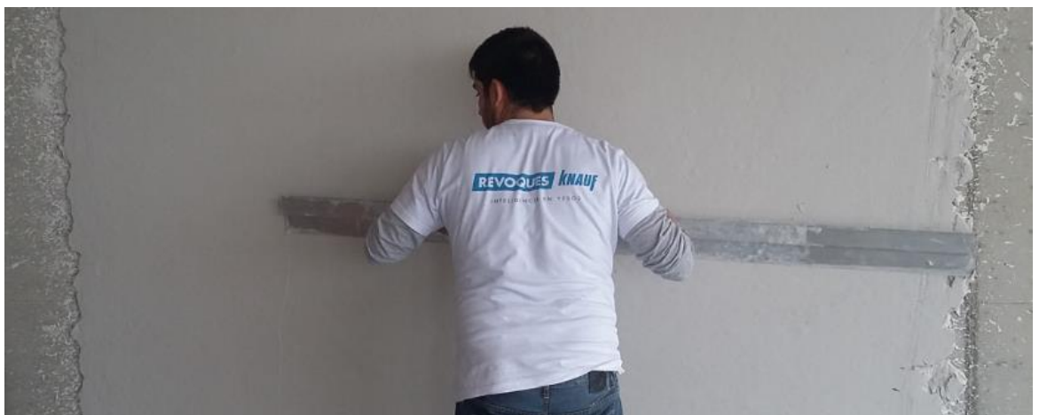
Fig. 17: Terminación y emparejado del enlucido de yeso con una regla metálica

Otra de las tareas efectuadas fue la de realizar pruebas de presión en las cañerías de agua fría y caliente, cañerías de aire acondicionado y cañerías de losa radiante. Se aplicó en cada caso una presión mayor a la de trabajo, anotando la lectura observada en un manómetro colocado en la boca de la cañería correspondiente. Se dejaba el sistema presurizado durante