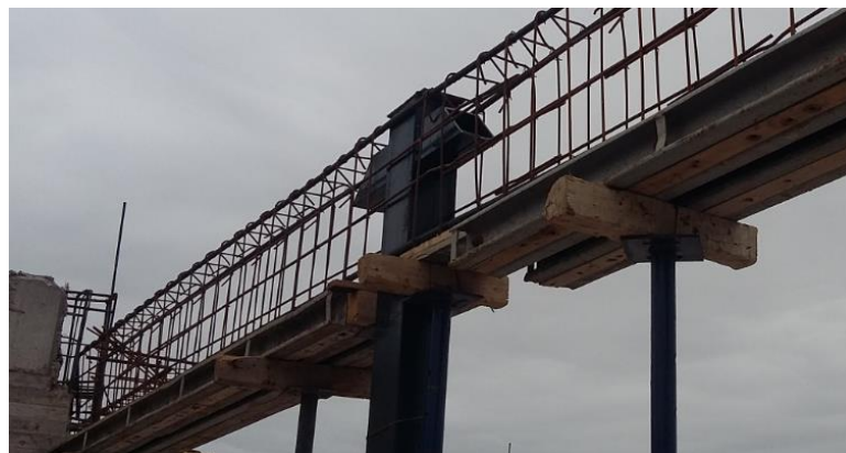
Fig. 3: Conexión de la columna metálica con la viga de hormigón