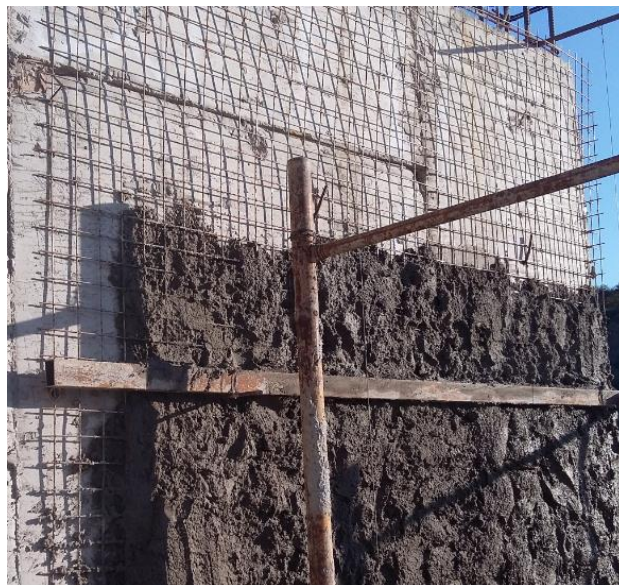
Fig. 15: Agregado grueso con soporte de malla metálica