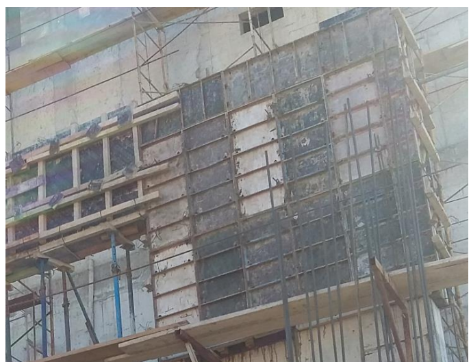
Fig. 5: Encofrados metálicos SOINSA