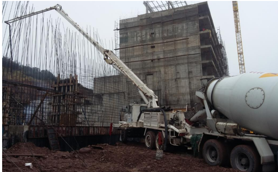
Fig. 6: Bomba telescópica

Como la cantidad de elementos a hormigonar era tan grande, se pedía hormigón elaborado junto con una bomba telescópica para acelerar los tiempos y facilitar el trabajo. Cada semana se vertían más de 50m 3 de hormigón entre tabiques, vigas y losas. Se hacía en cada caso un cómputo de los elementos encofrados hasta ese momento para encargar hormigón a la planta hormigonera.