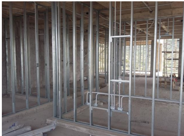
Fig. 12: Estructura de aluminio para el montaje de las placas de yeso

Para hacer el replanteo de la tabiquería interna dentro del edificio (demarcación de los locales), se definieron unos ejes de referencia en cada piso. A partir de los mismos y con la ayuda de una cinta métrica y un tizador (“chocla”) se marcaron en el suelo todas las líneas con la ubicación de todos los tabiques livianos que separan los distintos ambientes. Dichas paredes consisten en placas de yeso que se montan sobre una estructura de aluminio, las cuales permiten que en su interior se puedan colocar instalaciones y una lana de vidrio (función termo-acústica). La ventaja de este sistema constructivo es la rapidez de colocación y su bajo peso.