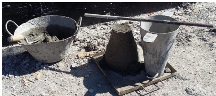
Fig. 7: Ensayo del cono de Abrams

Se realizó un control de calidad del hormigón a todos los camiones mixer hormigoneros que ingresaban a la obra, mediante el ensayo de consistencia del cono de Abrams. Se pidió un hormigón con un asentamiento de 7cm para posteriormente agregar aditivo fluidificante (para su colado con la bomba). Para que el ensayo diera positivo dicho asentamiento debía estar entre los límites de \pm 2 cm. Cabe destacar la importancia de este control en obra, ya que en dos ocasiones se tuvo que rechazar el camión con hormigón debido a que éste tenía una consistencia muy fluida (riesgo de que tenga agua en exceso, lo que puede afectar la resistencia y calidad del hormigón), habiendo realizado el ensayo 2 veces en cada situación.