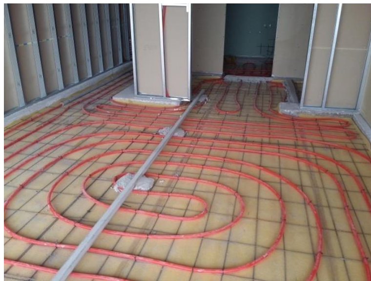
Fig. 10: Colocación de losa radiante

Sobre la losa estructural se definió colocar un contrapiso con hormigón alivianado con pomeca (generalmente se hacía en la misma obra, obteniendo un H-13) de 15cm de espesor, en el cual se utilizaba el sistema de calefacción por losa radiante. Para ello se tuvo que nivelar horizontalmente el piso de cada departamento, completando con hormigón las zonas faltantes (se emplearon fajas de hasta 2cm, según el desnivel). Luego, se colocó una membrana de espuma de polietileno (cumple una función termo-acústica), sobre la cual se agregó una malla de \phi 4,2\text{mm} (armadura mínima por contracción y temperatura). Finalmente, se distribuyó uniformemente la cañería de la losa radiante, completando dicho contrapiso con hormigón alivianado.