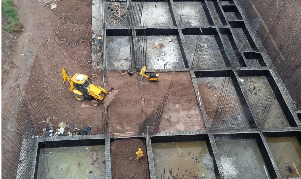
Fig. 2: Colocación del relleno entre las vigas de fundación

Otra tarea que se realizó con mucho detenimiento fue el control de armaduras en tabiques, vigas y losas. Se dieron algunos casos donde se detectaron algunos problemas, pero pudieron ser resueltos a tiempo: