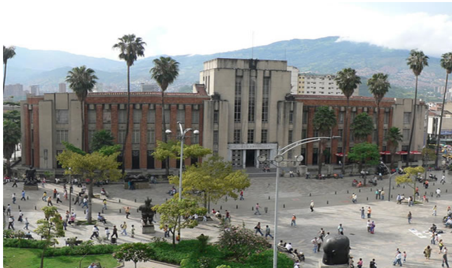
Fig. N° 2: Museo de Antioquia (Medellín – Colombia)