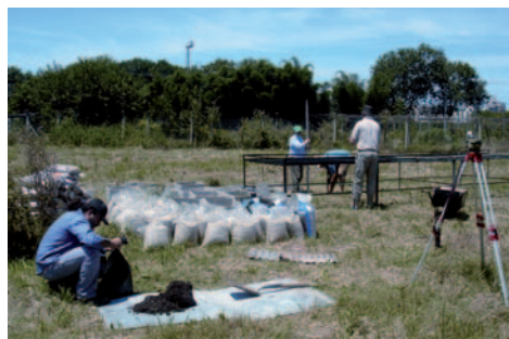
Figura 2. Nivelación de la estructura.