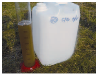
Figura 8. Probeta utilizada para realizar las mediciones de agua precipitada. Figure 8. Test tube used to perform measurements of precipitated water.