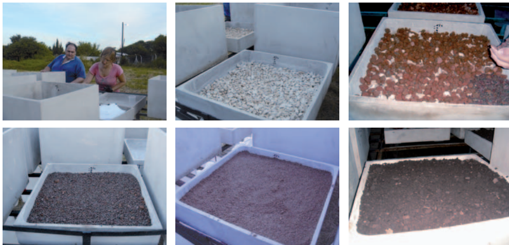
Figura 5. Capas de sustratos en el orden que se colocaron. (PP, L, B, A, T). Figure 5. Layers of substrates in the order they were placed. (PP, L, B, A, T).

Universidad de Buenos Aires se debió desplazar el ensayo a otro sitio), se realizaron las mediciones del agua drenada por cada parcela. Las mismas se realizaron con una probeta de 2 l graduada a 20 ml y una probeta pequeña para los casos de precipitaciones escasas (figura 8).