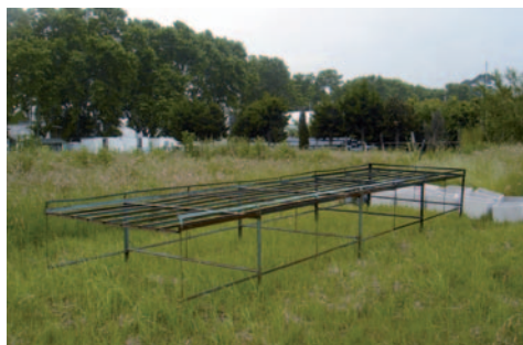
Figura 1. Estructura de hierro donde se montó el ensayo.