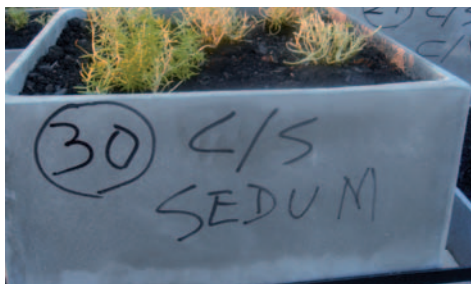
Figura 6. Detalle cubeta de 30cm de sustrato con Sedum . Figure 6. Tray detail with 30 cm of substrate with Sedum .