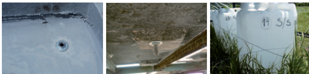
Figura 4. Detalle del drenaje de las parcelas y bidones.