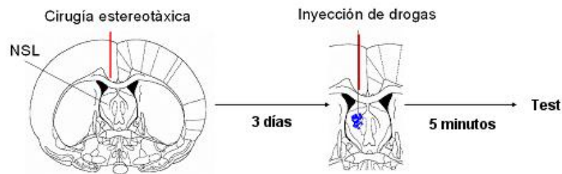
Figura 1: secuencia de procedimientos experimentales. En el panel A se muestra un corte coronal de cerebro con la cánula implantada sobre el núcleo septal lateral (NSL) derecho (prácticamente en contacto con el cuerpo calloso). En el panel B se muestra la inyección de reactivos en forma directa en el NSL.

GABAérgico (grupos pareados, ver Figura 1). El agonista GABAérgico muscimol fue administrado en las siguientes dosis: 2.5 y 0.25 \mu\text{M} . Al terminar el experimento todos los animales se sacrificaron por decapitación. Comprobamos el sitio de la inyección a través de la aplicación de tinta, empleando sólo los datos de aquellos animales que efectivamente fueron microinyectados en NSL.