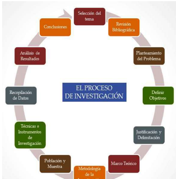
Figura 10 Esquema orientativo del ordenamiento de las etapas de la investigación.

A continuación, les dejamos un cuadro orientativo con los pasos para el desarrollo de su trabajo.