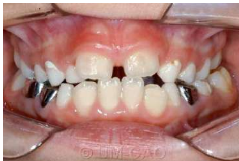
Figura 5 Esta imagen muestra un problema transversal, identificado por la mordida cruzada unilateral y un problema vertical por no existir entrecruzamiento dentario u overbite.