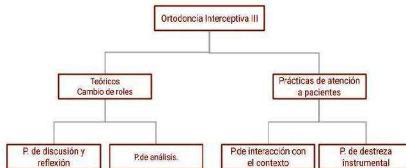
Figura 9 Cuadro informativo de clases y sus correspondientes practicas.

Diseño de práctica que se constituye en una experiencia pedagógica decisiva. Prácticas transformadoras.