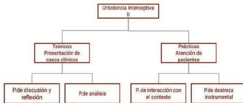
Figura 8 Cuadro informativo de clases y sus correspondientes practicas