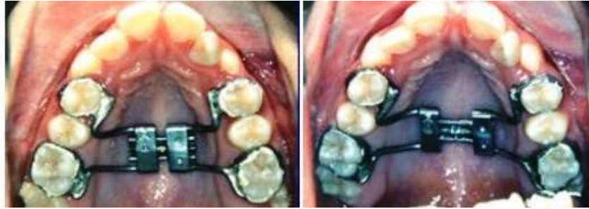
Figura 7 Disyuntor e Hass antes y después de la activación

Una vez interpretado el diagnóstico de las mordidas cruzadas transversales y de haber individualizado este tipo de alteración esquelética les presentamos los distintos tipos de diseño de aparatos para su corrección, o sea para realizar una disyunción maxilar, sus características y sus indicaciones en la clase presencial y práctica.