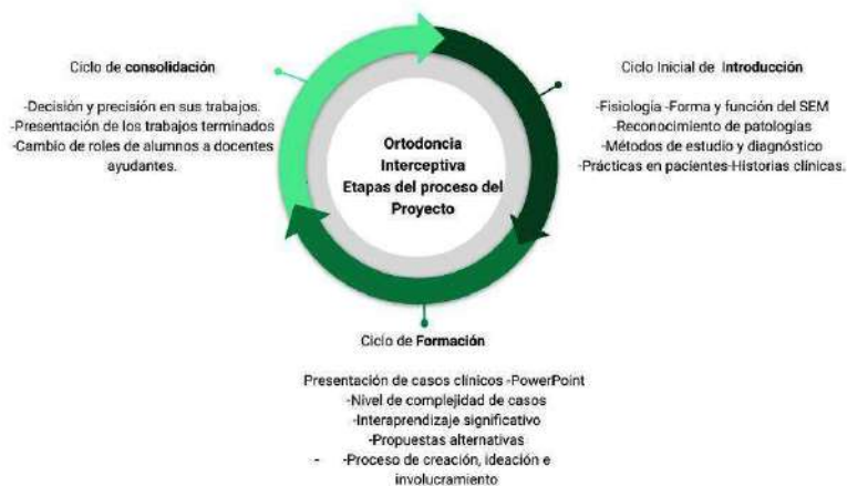
Figura 1 Un ciclo inicial, que llamamos de introducción, que se extiende hasta finalizar Ortodoncia interceptiva 1, en el primer año de la Carrera.

Este proceso se sintetiza en los siguientes ciclos o fases que permiten establecer las metas a alcanzar por los estudiantes al final de cada ciclo: