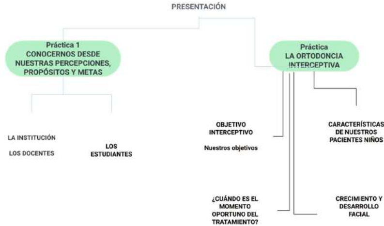
Figura 3 Esquema de temas y prácticas. Ortodoncia interceptiva I- Unidad 1