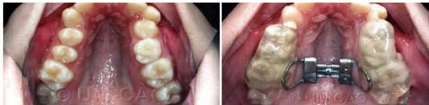
Figura 6 Disyuntor de McNamara

Hecha la presentación de ambas aparatologías utilizadas en la clínica y habiendo conversado el tema en los teóricos, les ofrecemos ampliar la información con los siguientes materiales de estudio.