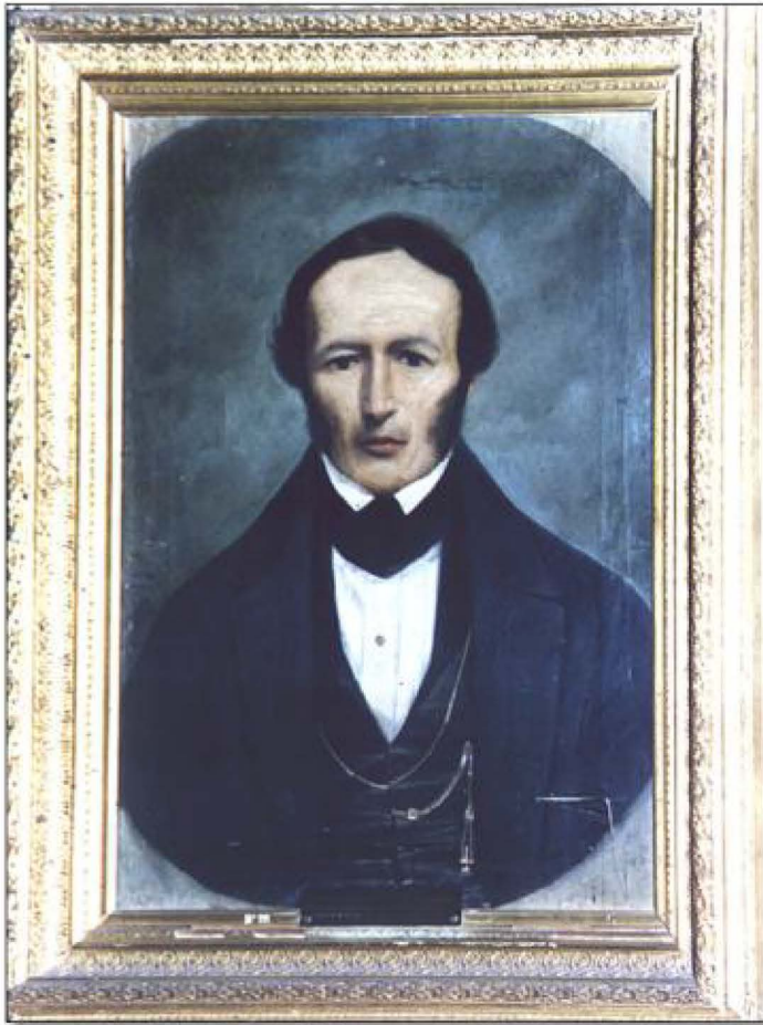
Fig. 4. Coronel Juan de Rosas (1848). Gregorio Torres.