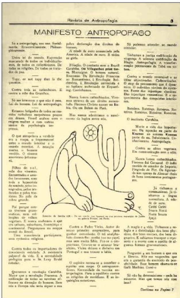
Fig. II Oswald de Andrade, Manifesto Antropofágico, Revista Antropofagia, Año 1, Nº 1, 192811.