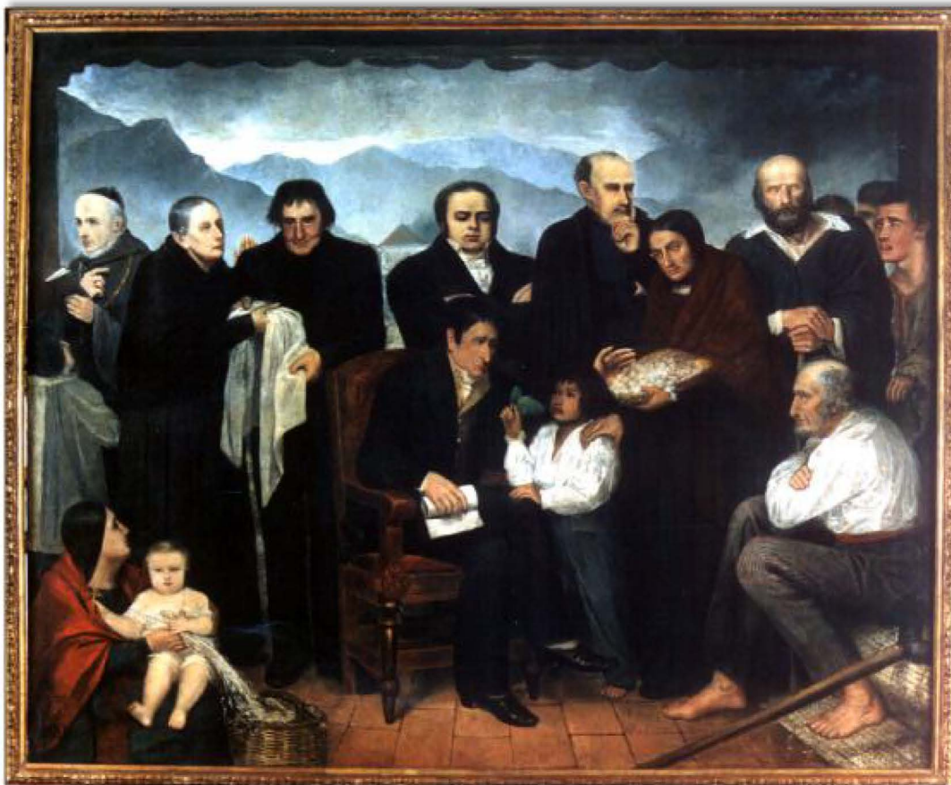
Fig. 3. La Beneficencia (1847). Gregorio Torres.