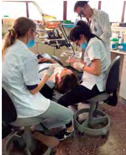
Foto 5 y 6: Alumnos de grado trabajando en clínicas, se observa el uso de magnificación y tecnología CAD CAM.

El programa de Posgrado de Especialización en Rehabilitación Oral tiene una duración de 4 años, con distribución clínica y didáctica de acuerdo con los estándares internacionales recomendados. El programa didáctico contiene temas curriculares primarios y secunda-