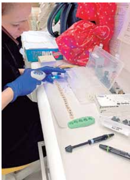
Foto 11: Alumna de posgrado trabajando en su proyecto de investigación.