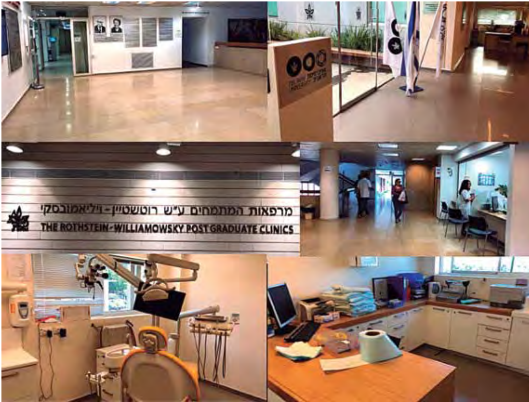
Foto 9: Ingreso e instalaciones de la Clínica de Posgrado de la Escuela de Medicina Dental Universidad de Tel Aviv.