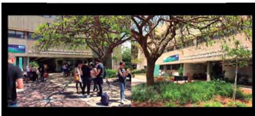
Foto 1: Fachada de la Escuela de Medicina Dental Maurice and Gabriela Goldschleger – Universidad de Tel Aviv.