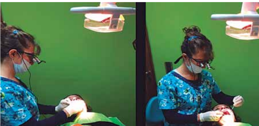
Foto 18: Haciendo uso de mi Lupa con luz led adquirida en Israel.

ágape y evento social con diversas actividades.