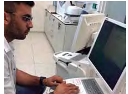
Foto 7: Alumno de grado realizando su trabajo de investigación en CAD CAM.