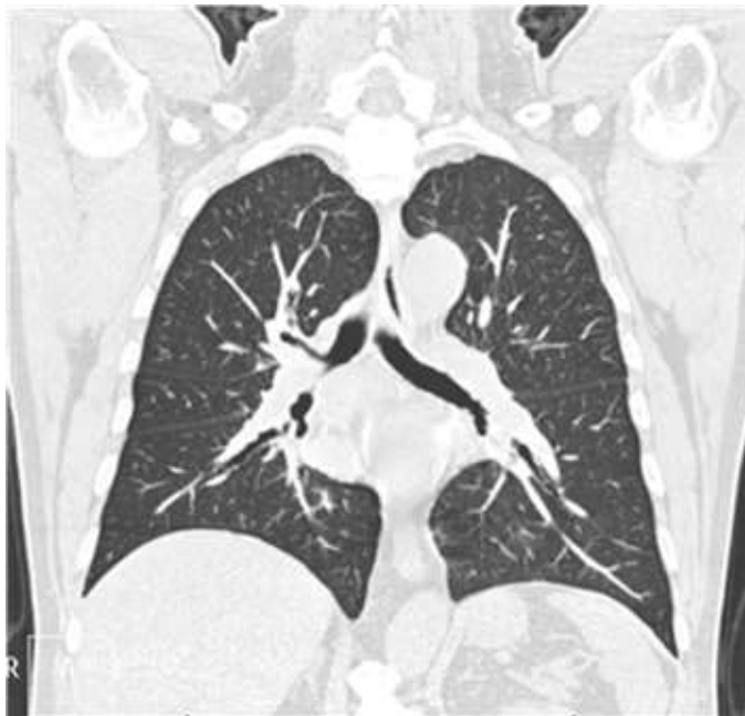
Foto 2: Se observa estenosis bronquial de bronquio fuente derecho