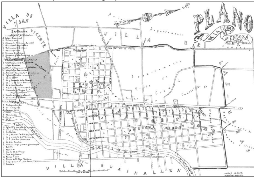
Figura 1. Ciudad de Mendoza. Ubicación de la Escuela Nacional de Vitivinicultura (resaltado en gris), 1896.