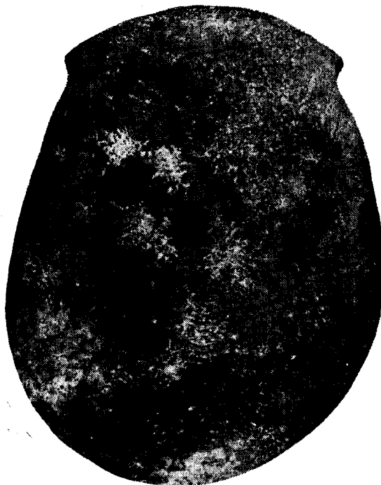
Fig. 9. — Norma superior del cráneo.

Según hemos expresado al comienzo, este trabajo estaba orientado esencialmente a la descripción de un hallazgo original; ya que son