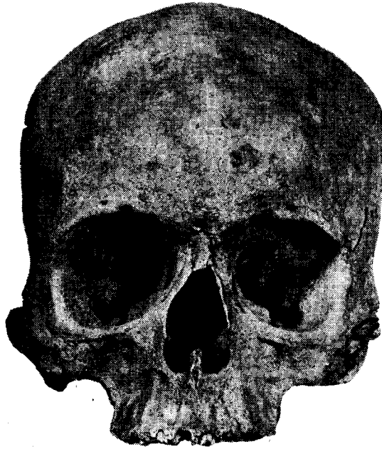
Fig. 7. — Norma frontal del cráneo.