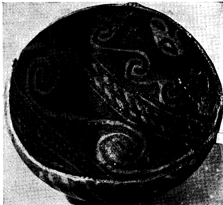
Fig. 4. — Puco. — Decoración interna.