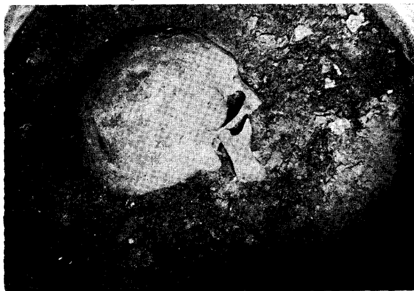
Fig. 6. — Detalle de la ubicación del cráneo.