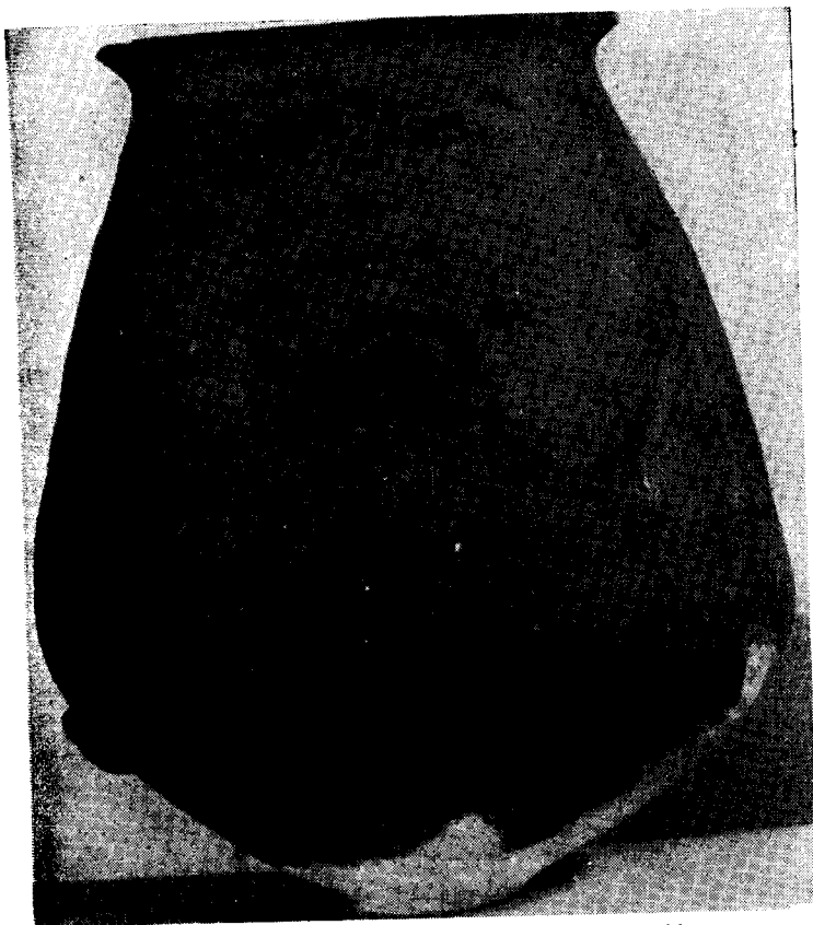
Fig. 2 - Urna. Decoración antropomorfa con los ojos abiertos