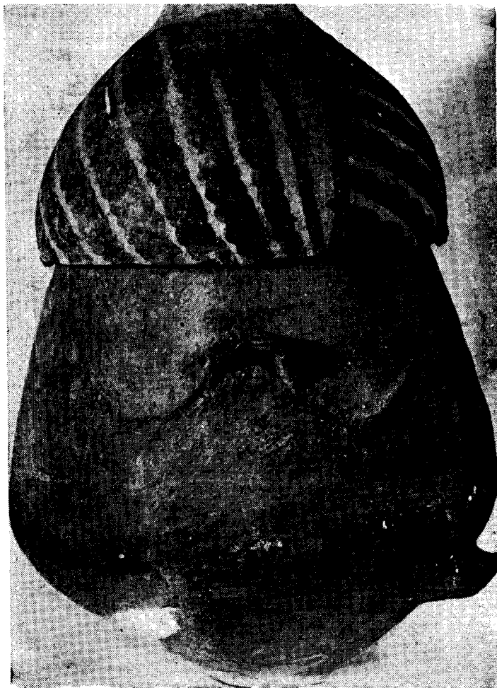
Fig. 1. — Urna tapada con el puco tal como fue hallada.

La forma de la urna es más o menos subglobular terminando en un cuello corto. La base que es relativamente pequeña tiene dos asas, aplicadas, no remachadas. Las medidas principales son las siguientes: