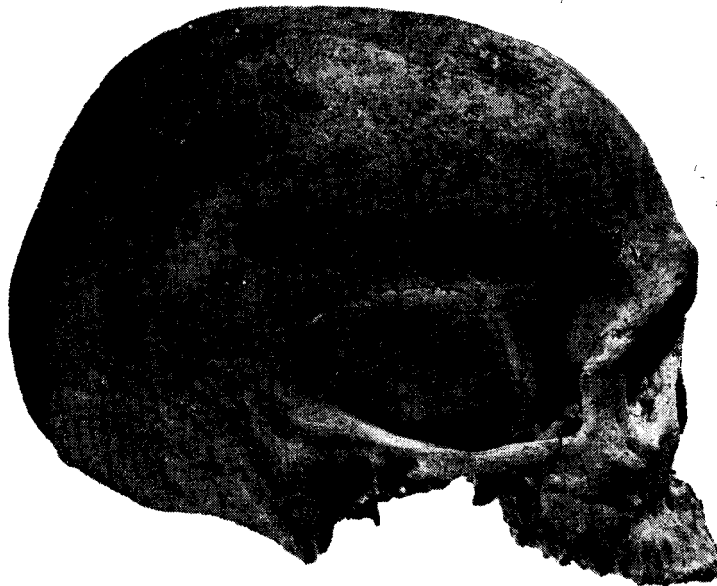
Fig. 8. — Norma lateral del cráneo.