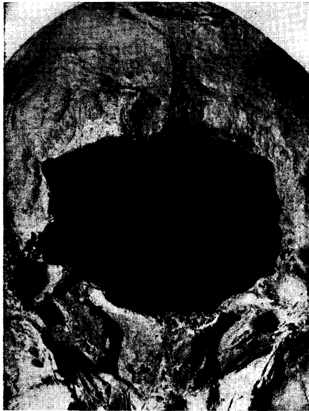
Fig. 10. — Detalle de la mutilación basilar.

Refiriéndonos al cráneo mutilado no cabe dudas que se trata de un cráneo trofeo. No pretendemos realizar un examen exhaustivo de