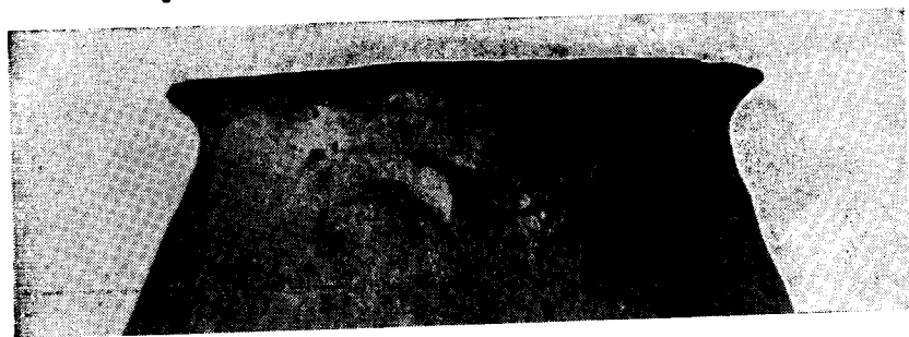
Fig. 3 - Urna. Decoración antropomorfa con los ojos cerrados

Díámetro base: 106 mm. Base: Cóncava-convexa. Asas: Horizontales, de sección subrectangular. La abertura superior es mayor que la inferior.