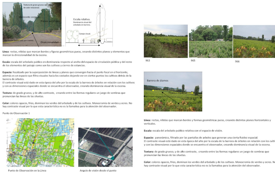
Fig. 5. Relevamiento y análisis visual y espacial del área de estudio. Ejemplo de una ficha realizada.