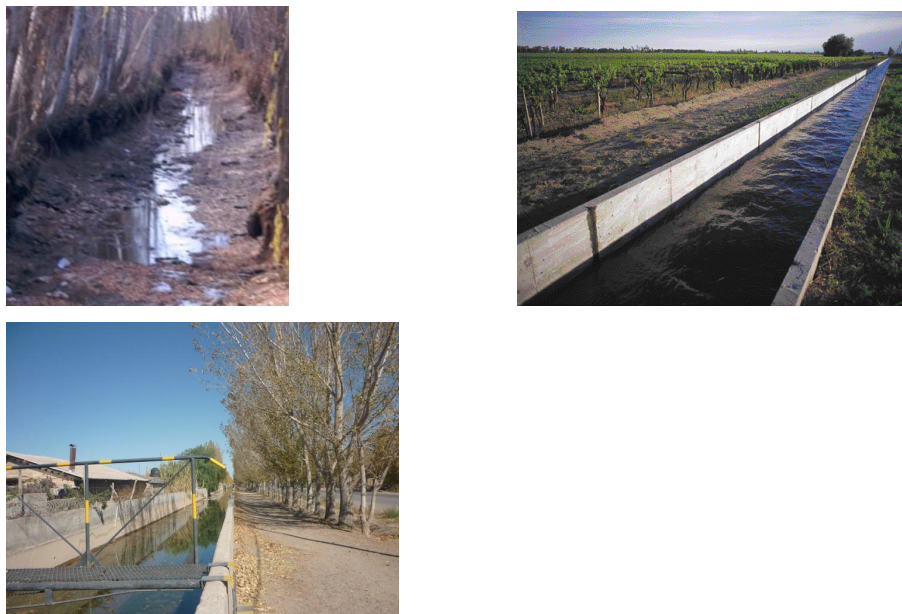
Fig. 2 Canal San Martín, antes y después de la impermeabilización