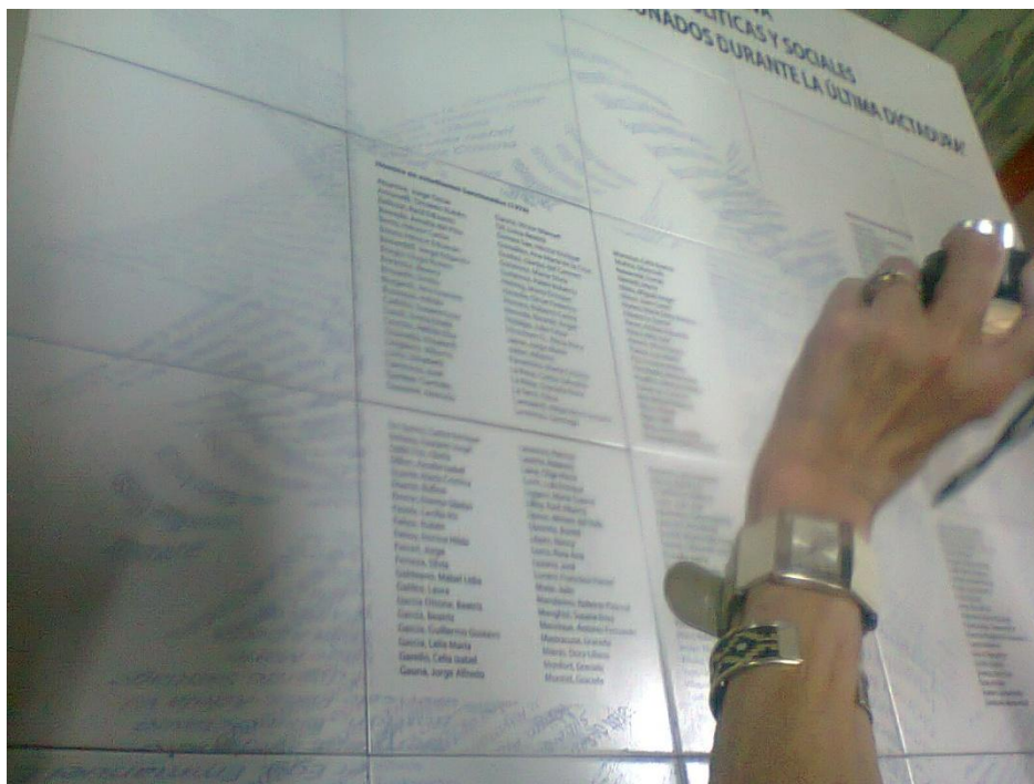
Placa recordatorio de víctimas (desaparecidos, cesanteados y exiliados) de la Dictadura militar de la Facultad de Ciencias Políticas y Sociales, UNCuyo.