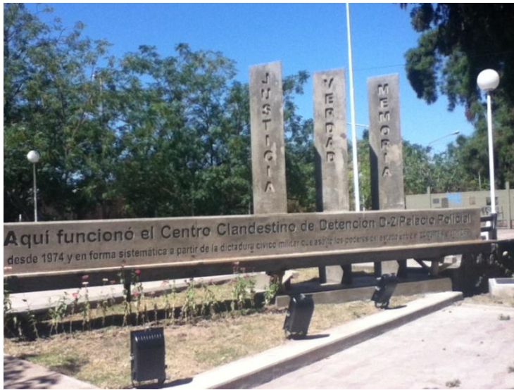
Placa monumento en el Centro Clandestino D2.

actuamos en el presente. “La simbolización en el espacio del pasado se constituye en una manera de incidir en ambos, pasado y presente.” (Chaves y Paredes 2012).