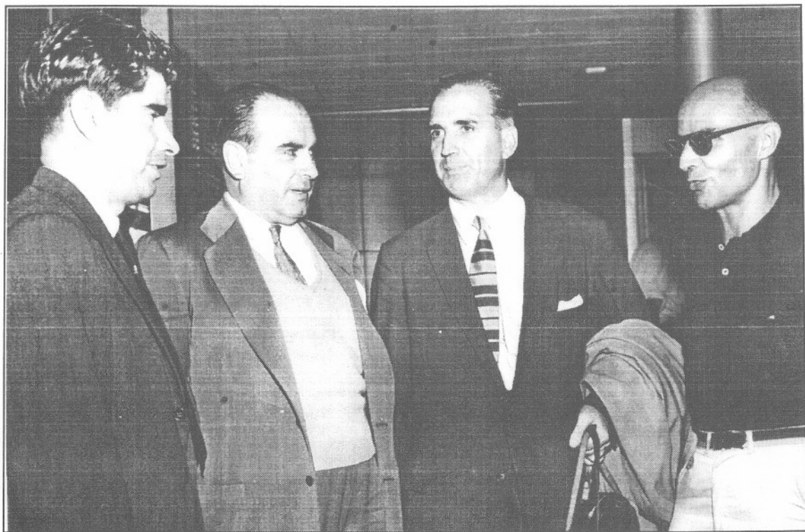
De izquierda a derecha: Leopoldo Zea, Eduardo García Maynez y Arturo Ardao V Congreso Interamericano de Filosofía Washington DC - 7 de Julio de 1957