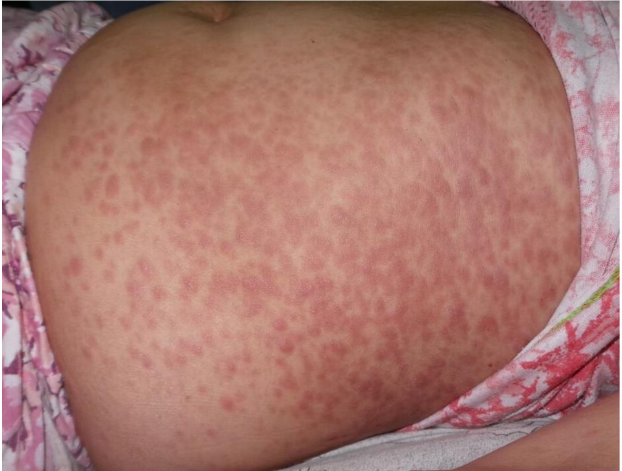
Figura 1: Lesiones eritemato-violáceas infiltradas en tronco